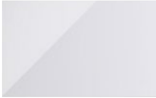
ZN2017002 SNOW-N BLANCO BRILLANTE / NO RECTIFICADA 25 x 40 cm / 1.5 m 2