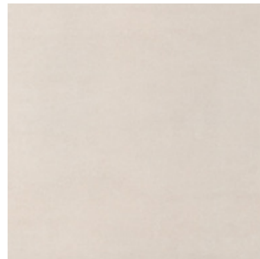
URBAN OFF WHITE