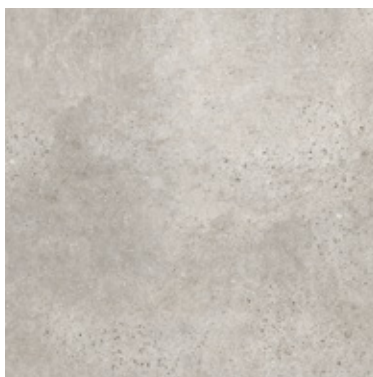
GREY - 60x60 cm

MATE - KR2021037 LAPATO - KR2021038 ANTISLIP - KR2021039