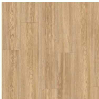
ROBLE SORIA NATURAL ITEM0524 - EG2022018 + COMPLEMENTOS Poros sincronizado