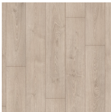
ROBLE NORTE CLARO ITEM0526 - EG2022019 + COMPLEMENTOS Poros sincronizado