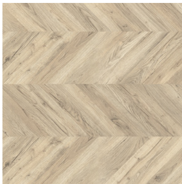
RILLINGTON OAK ITEM0527 - EG2022002 + COMPLEMENTOS