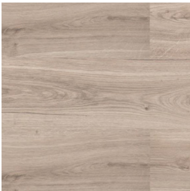
AZAHAR FP2022006 - Producto a pedido