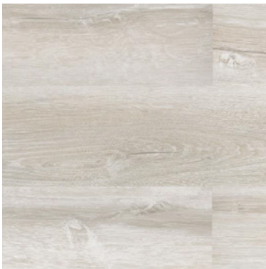
FRESNO FP2022005 - Producto a pedido