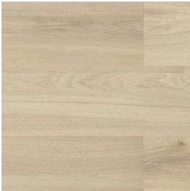
ULMO ITEM0522 - FP2022003 + COMPLEMENTOS