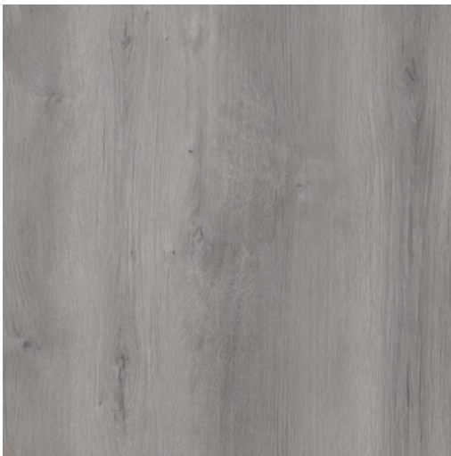
NEWPORT SMOKY OAK HF2022004 - 1230x180x5.7mm