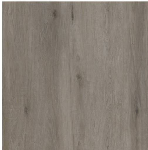
NEWPORT GREIGE OAK HF2022003 - 1230x180x5.7mm