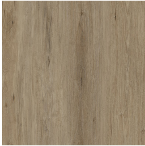
NEWPORT CLASSIC OAK HF2022002 - 1230x180x5.7mm