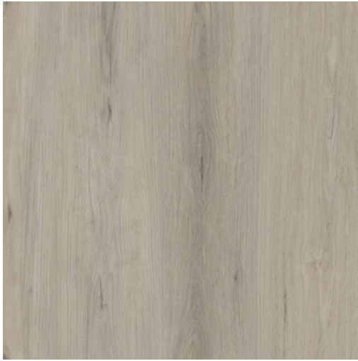
NEWPORT WHITE OAK HF2022001 - 1230x180x5.7mm